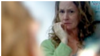
Mrs. Miller Melissa Leo